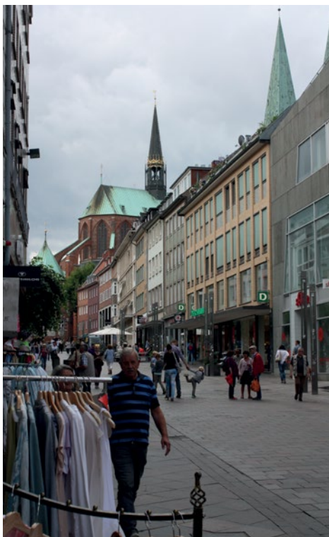
Marienkirche i Lübeck.

Konkurrence har altid ligget i mennesket, konkurrence og lyst til at præstere noget stort og så stoltheden over præstationen bagefter, glæden ved at vise frem. Ethvert menneskeligt fællesskab vil gerne vise, hvad det kan præstere. I sommerens rundvisninger i Jetsmark Kirke har jeg flere gange gjort opmærksom på sognets lyst til at vise, hvad det formår, når jeg har skullet give en forklaring på, at man midt i 1400-tallet gik i gang med det store projekt at bygge tårn og våbenhus på Jetsmark Kirke, at bygge hvælvinger ind i kirken i stedet for