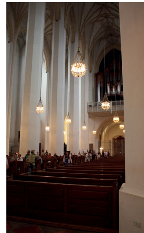
Frauenkirche i München.