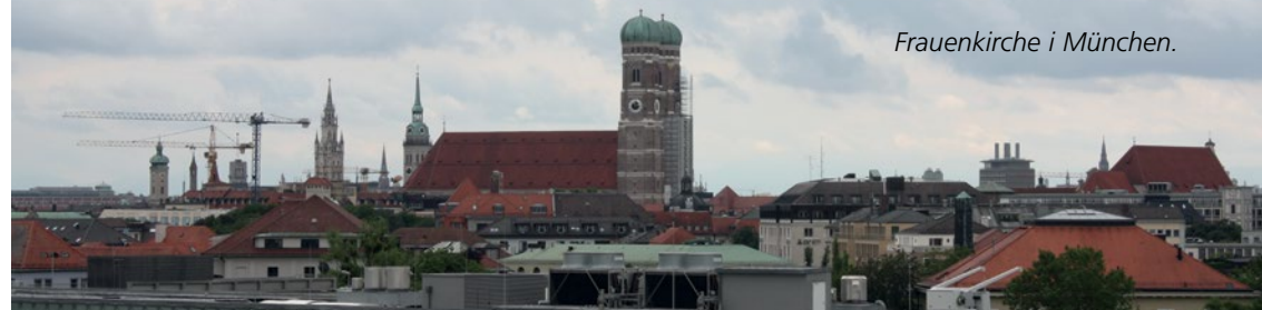
Frauenkirche i München.

Lübeck og de andre hansestæder er kendt for de fantastiske teglstenskatedraler, som blev bygget i 1300-tallet. Marienkirche i Lübeck er den mest fantastiske. Den bliver kaldt "teglstensgotikkens moder", et arkitektonisk hovedværk, en model, som der blev bygget 70 andre kirker over i Østersøområdet. Marienkirche er fantastisk at gå ind i og så kigge op i de høje hvælvinger, og de to tårne kan ses vidt omkring.