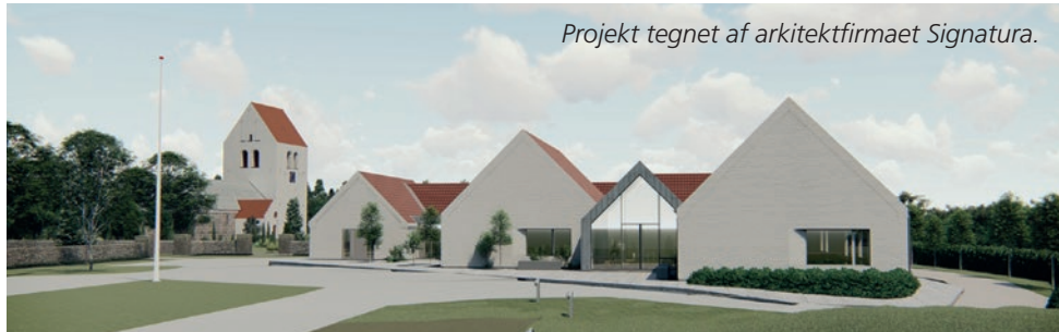
Projekt tegnet af arkitektfirmaet Signatura.