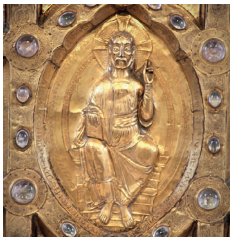
Jesus i hans sande majestæt som verdensheriker i en mandorla. Fra det gyldne alter i Sahl Kirke.

Kristendommen er afgørende og det bærende element. Hvorfor går vi så ikke bare tilbage til kristendommen? Jo, vi er desværre fanget i en "dørtærskel-idé" (Marilynne Robinson). Med det modernes komme forsøgte vi at erstatte kristentro med fornuftstro og videnskabelig erkendelse. Vi har så undervejs opdaget den rationelle tæknings begrænsning i forhold til virkeligheds erkendelsen. Vi kan ikke erkende virkeligheden som sådan, men kun virkeligheden, som den ser ud for os. Derefter har vi i postmoderne tid forsøgt at overbevise os selv om, at der sagtens kan eksistere flere sandheder ved siden af hinanden,