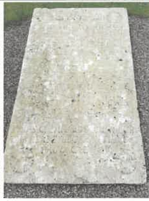
"Den ulæselige" sten "Latin" sten